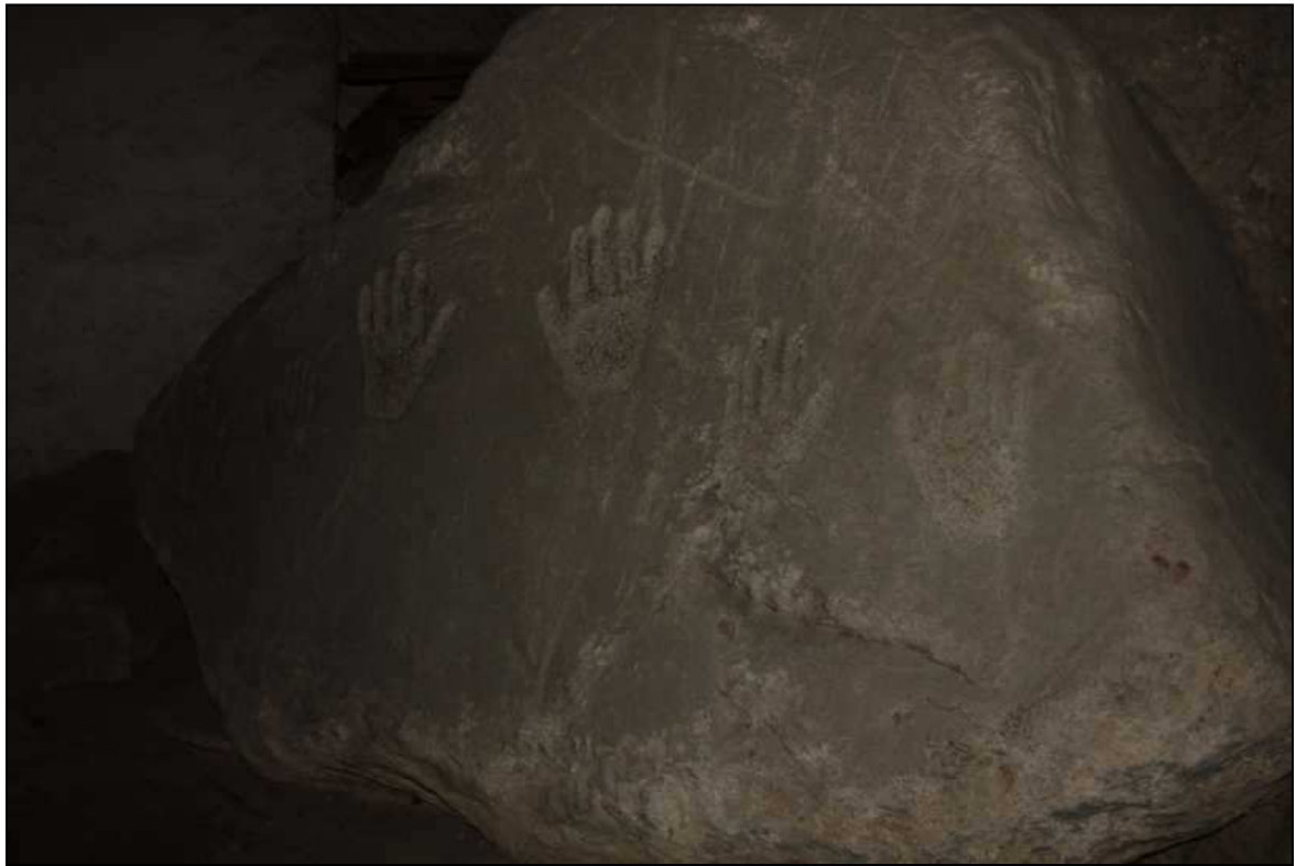
La roccia con le impronte delle mani.