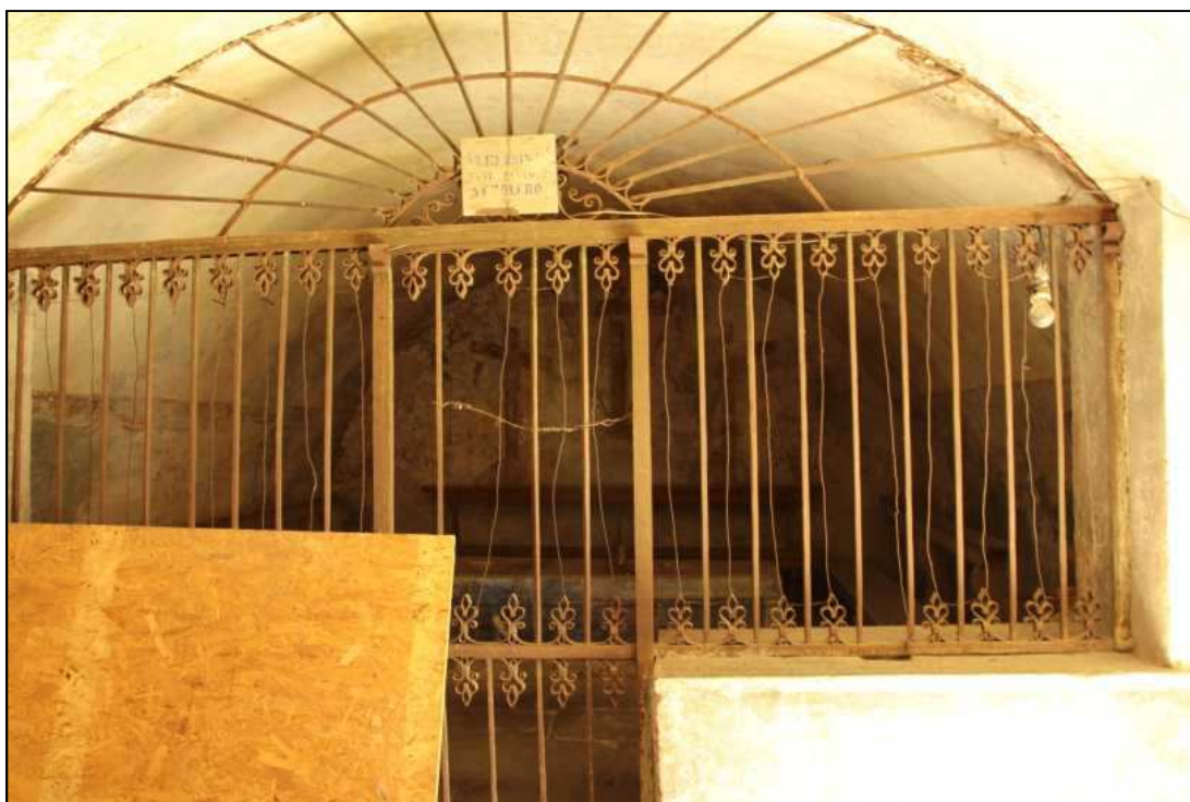
La cappella con la roccia delle mani delle sante.