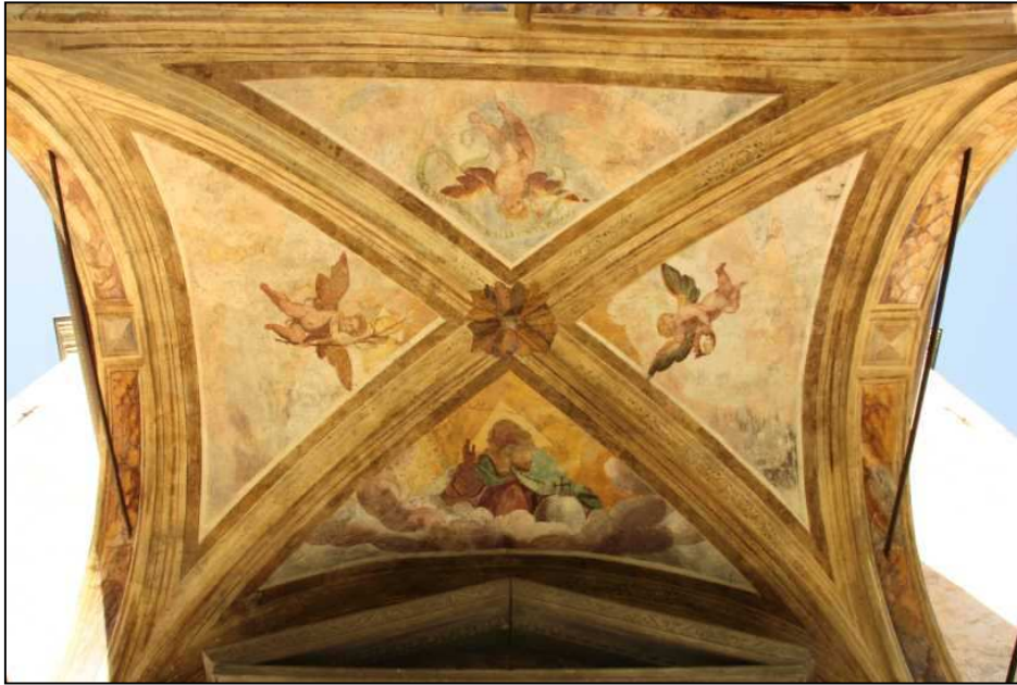
Soffitto del portico della chiesa.