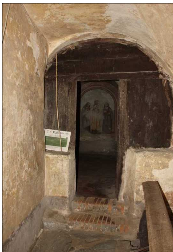
In alto: campanile e affreschi esterni della chiesa. In basso: affresco con i santi Faustina, Liberata e Marcello.