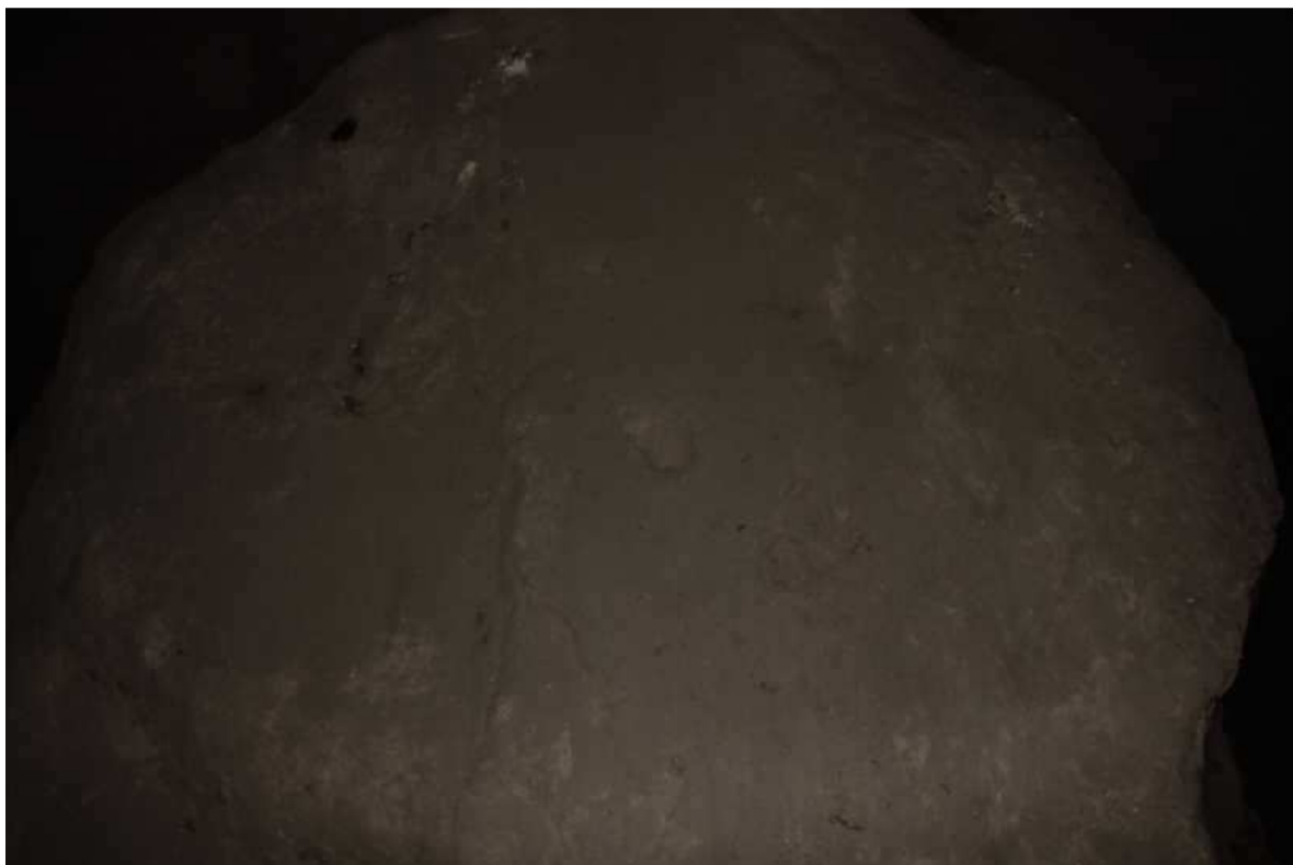
Altri segni sulla roccia.