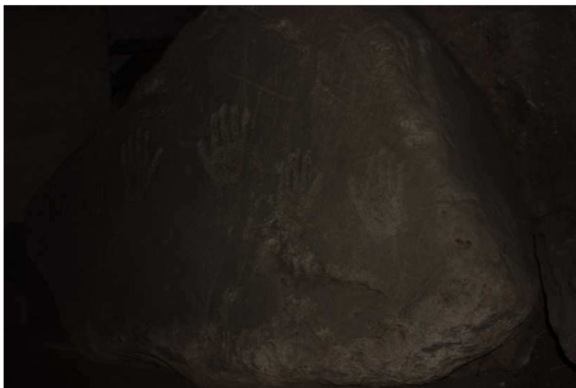
La roccia con le impronte delle mani.