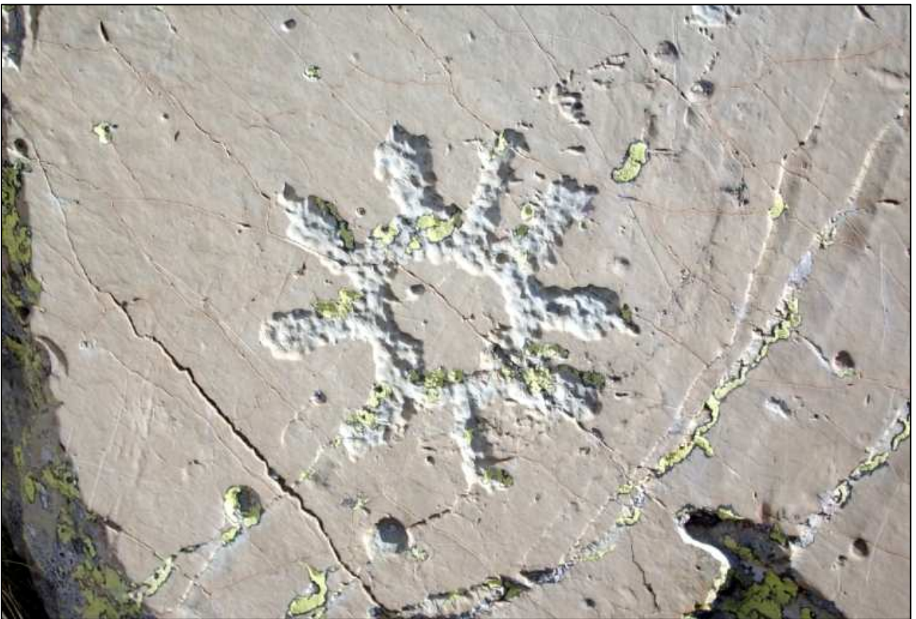
L'ammasso aperto delle Pleiadi (sopra) ed il Sole a nove raggi (sotto) istoriati sulle rocce del Monte Bego.