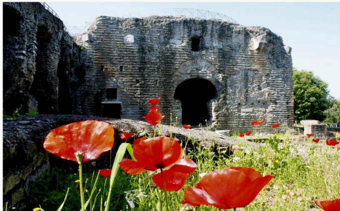
Villa Adriana, Roccabruna: nella cupola al suo interno ancora oggi il sole crea una lama di luce durante il solstizio estivo

Alla ricerca dell'immaginario celeste nelle pietre del passato